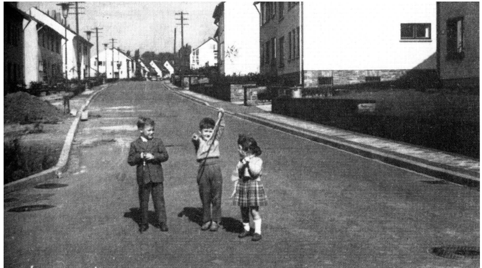
Abb.1: Kohlweg in den 50iger Jahren

Bestand der Ortsbezirk Rotenbühl bei Kriegsende aus kaum mehr als einigen Wohnstraßen, einer Handvoll kleiner Fabriken, Scheunen und Felder, so ist er mittlerweile ein bekanntes und begehrtes gutbürgerliches Wohngebiet. Diese Entwicklung bedeutet zugleich auch ein halbes Jahrhundert erfolgreicher CDU-Politik am Rotenbühl.