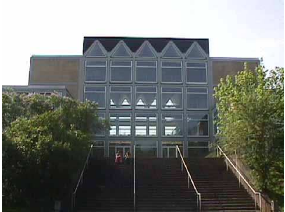
Abb.3: Gymnasium am Rotenbühl

Dem stetigen Wachstum des Ortsteiles wurde überdies mit den Kirchenneubauten und dem Sportplatz am Kieselhumes Rechnung getragen.